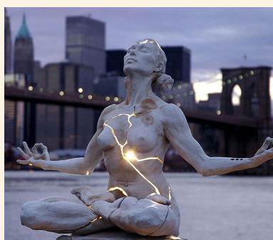
Expansão Paige Bradley