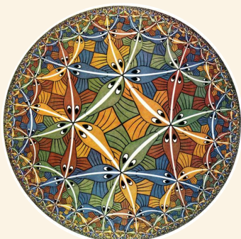
Maurits Cornelis Escher Círculo limite III

Experiência Ato de interrupção Algo te toca, te afeta