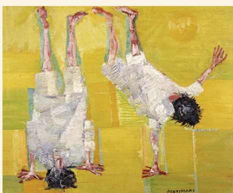
Cambalhota Cândido Portinari

Neste infográfico construiremos o conceito Aprendizagem criativa em Matemática e Arte através de um diálogo entre os autores, imagens e palavras chaves.