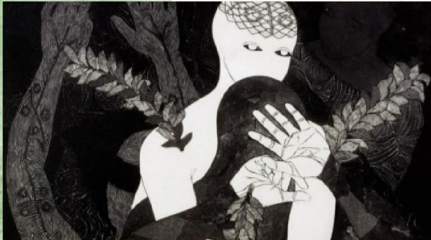
Obra elegida: Sin título, 1999 - Belkis Ayón

Deja que mi mano te console, con esas líneas puedo decirte eso es pasajero, no te dejes padecer Intenta hablar, eso te puede ayudar con un abrazo, mi única necesidad es que tu interior me pueda expresar.